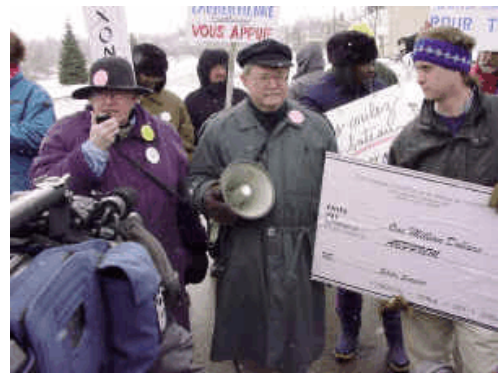
Visite de solidarité lors de la grève à l'Université de Moncton, 2000

La Caisse de défense de l'ACPPU assure un appui inestimable lors de la négociation d'une nouvelle convention collective. Pendant le processus de négociation, les syndicats universitaires peuvent utiliser des stratégies qui ont fait leurs preuves, comme par exemple la menace de grève, le vote de grève et la grève du zèle. Malheureusement, il y a des situations où ces méthodes échouent et où une grève ou un lock-out est déclaré. Lorsqu'un tel scénario se produit, la Caisse de défense de l'ACPPU fournit un appui financier, politique et psychologique essentiel.