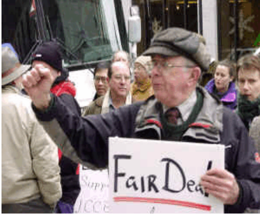
Manifestation des grévistes de UCCB à Halifax, 2000

La Caisse de défense de l'ACPPU a été créée en 1978 pour fournir un fonds de grève unifié aux syndicats de professeurs, professeurs et bibliothécaires d'université du Canada. Formée d'associations membres de l'ACPPU, elle rassemble aujourd'hui 38 associations représentant plus de 18 000 professeurs et bibliothécaires, de Saint-Jean (Terre-Neuve) à Régina.